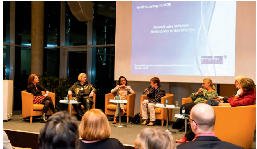
MDR Frauentag 2014