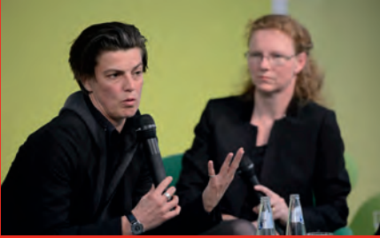
Carolyn Emcke, Medienlabor 2013