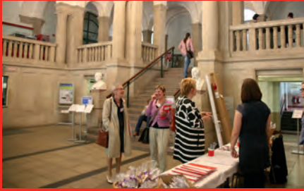
Jahrestagung in der Fachhochschule Köln, 2014