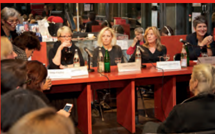
Medienlabor 2014 zur Boulevardisierung der Medien