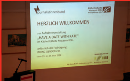
Auftaktveranstaltung JaTa 2014 im Käthe Kollwitz Museum Köln