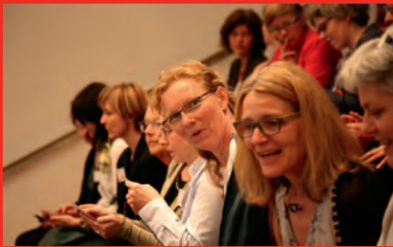
Blick ins Publikum beim Auftakt der JaTa 2014