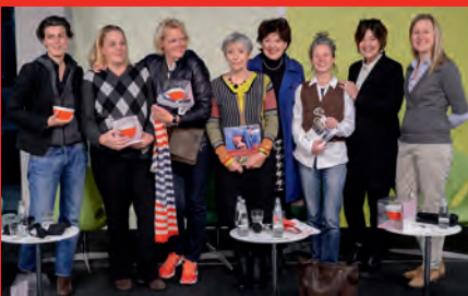
„Journalistinnen in der Kriegs- und Krisenberichterstattung“, 2013