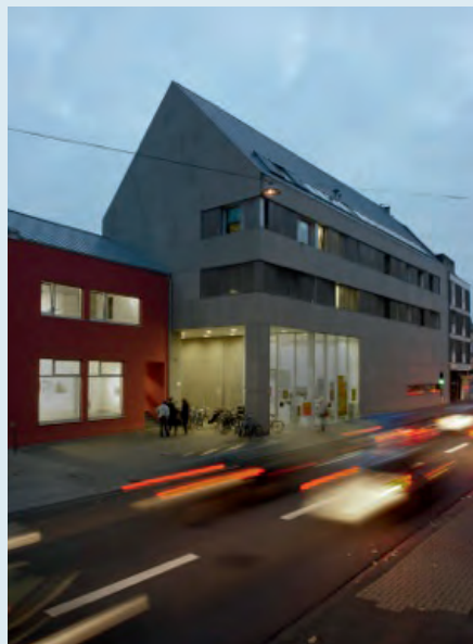
Neubau Kunsthochschule für Medien