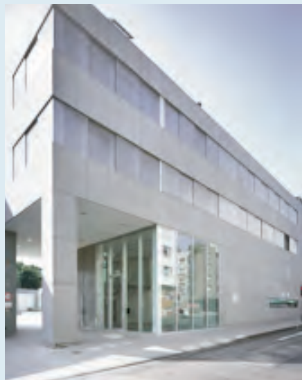
Neubau der Kunsthochschule für Medien Köln

Wichtig: Für alle Führungen ist Ihre Anmeldung vorab erforderlich. Bitte bei der Anmeldung eintragen.