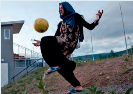
Filmausschnitt aus „Die Ersten auf dem Platz“ L. Ahmadzai