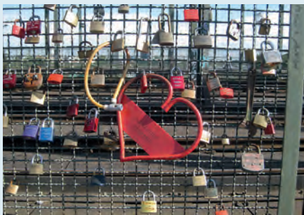
Liebeschlösser an der Hohenzollernbrücke Perkins