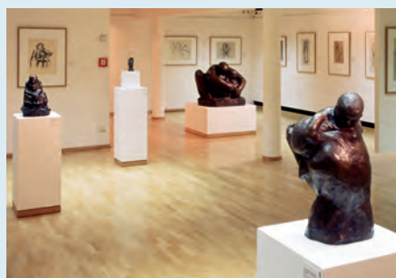
Käthe Kollwitz Museum Köln F. Monheim