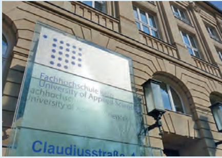
Fachhochschule Köln E. Hehemann