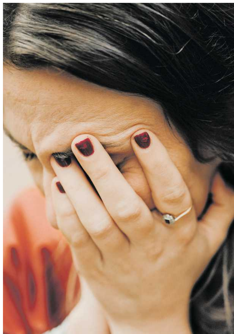
Die Protagonistin dieses Dossiers bat darum, dass sie und ihre beiden Töchter auf den Bildern nicht zu erkennen sind

VON VALERIE SCHÖNIAN